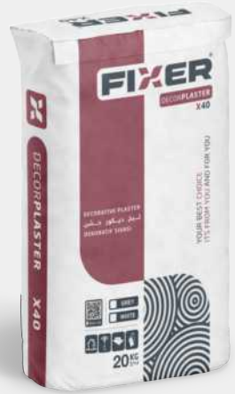
DECORATIVE PLASTER لبخ ديكور خشن DEKORATIF SIVASI