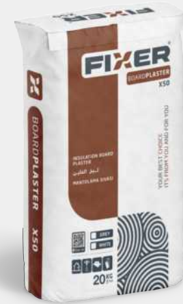
INSULATION BOARD PLASTER لبخ الفلين MANTOLAMA SIVASI