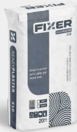
READY PLASTER لبخ جاهز ناعم HAZIR SIVA